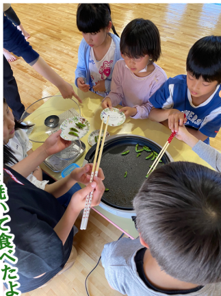
スナップえんどうを焼いて食べたよ！