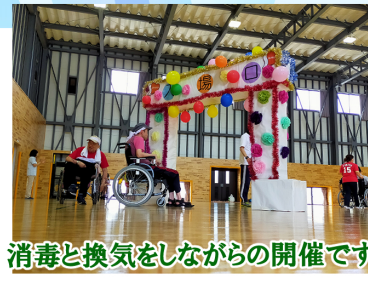
消毒と換気をしながらの開催です

「外に出られない期間が長かった。 運動会では笑うこと、楽しむことができ、 ストレス発散になりました。」