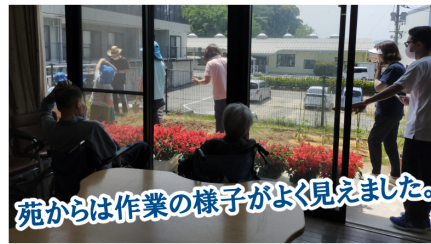
苑からは作業の様子がよく見えました。