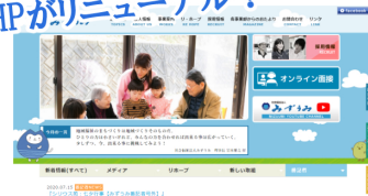
公式HPがリニューアル！

3つ目は、みずうみパンフレットのリニューアルです！今回のパンフレットには、みずうみ保育園体育館や在宅ステーション、Re×hopeなど、みずうみの新しい施設や取組についても掲載しています。ぜひご覧ください！