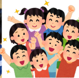
ドミノ倒し、たのしいね