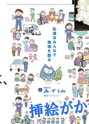
挿絵がかわいい新パンフレット！