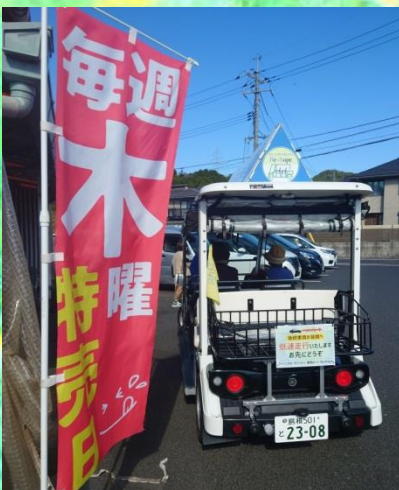
ハローさん 毎週木曜特売日♪